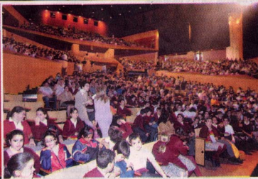
Varios momentos de la representación del espectáculo en el auditorio Alfredo Kraus. Arriba, los actores mientras The Beatles Group interpreta un tema. Abajo, a la izquierda, la orquesta sinfónica de 20 músicos; a la derecha, un aspecto del patio de butacas.

en la iglesia de San Marcos antes de ir a las grandes cortes. Prefirió esa reclusión, por eso otro mensaje es que los genios pueden ser genios con un valor humano", señala Afonso.