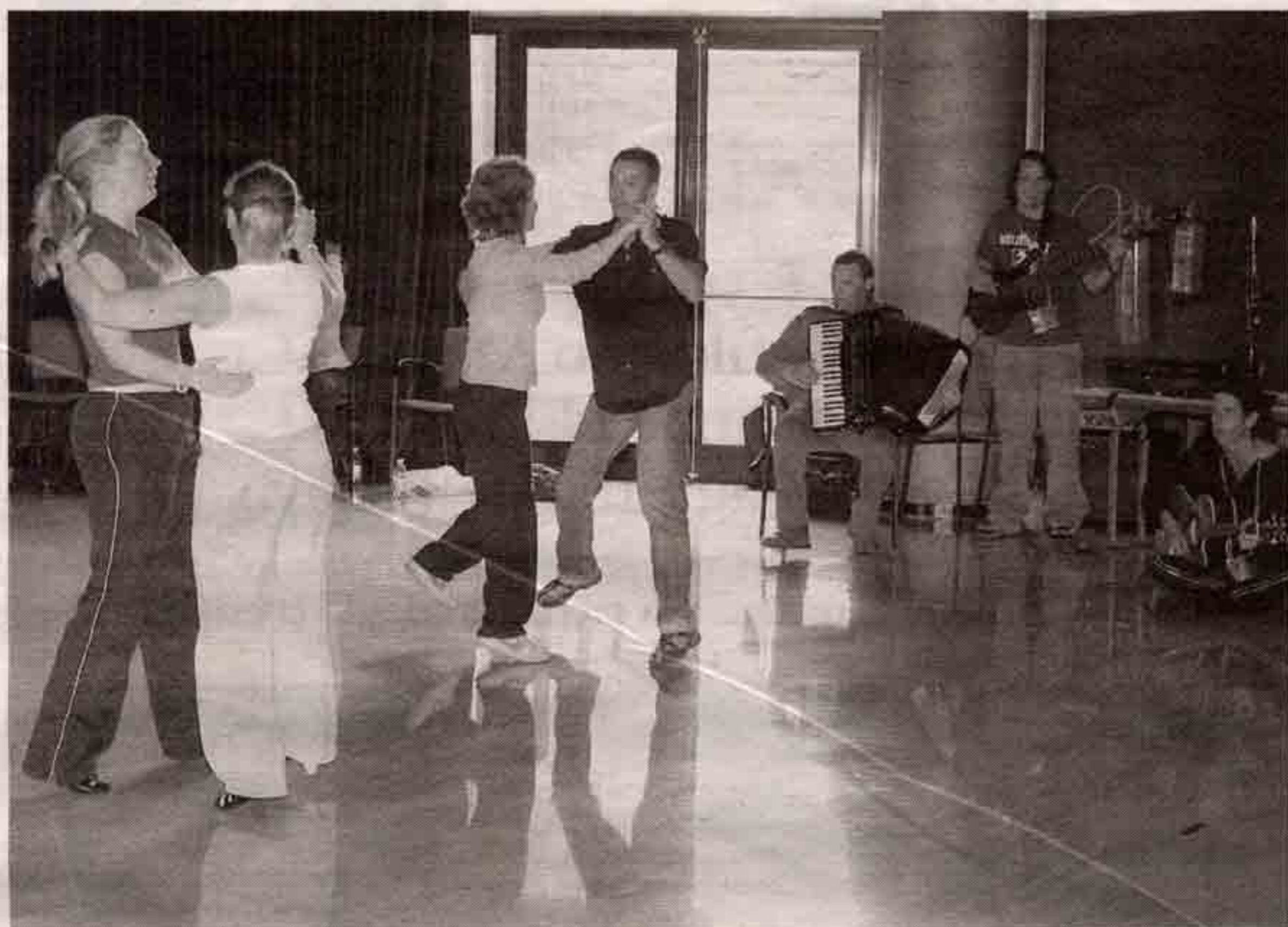
Ensayo de El gnomo irlandés con los profesores de la compañía Attridge, de Cork, ayer en el Auditorio. | RUBÉN SÁNCHEZ