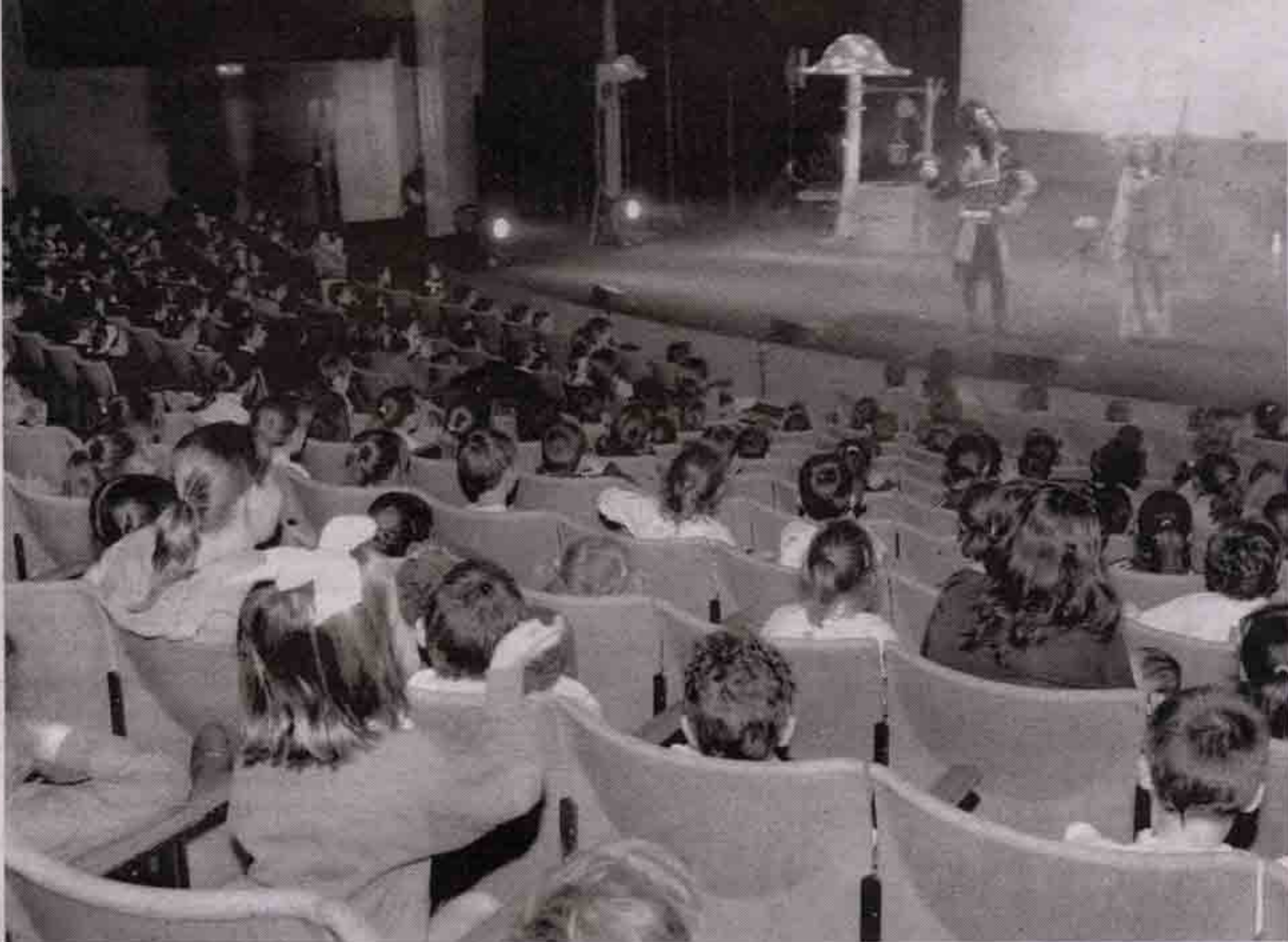
Un instante de la sala sinfónica del auditorio Alfredo Kraus, ayer por la mañana.